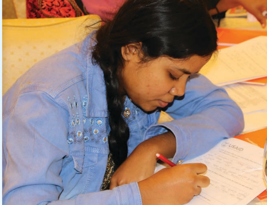
Una joven participante en una actividad dirigida por nuestro proyecto Promoviendo Defensoría y Derechos (Promoting Advocacy and Rights) en Bangladesh.

A pesar de algunos avances, la vida pública de Bangladesh sigue estando dominada por los hombres. Para contrarrestarlo, el proyecto facilitó el surgimiento de 19 mujeres líderes en sus programas de 2023, dándoles la plataforma para movilizarse y defender los derechos de los grupos marginados a escala nacional. También apoyó a más de 2,000 mujeres mediante iniciativas de fortalecimiento de capacidades y apoyo, y desarrolló planes de acción de igualdad de género e inclusión para todos los beneficiarios.