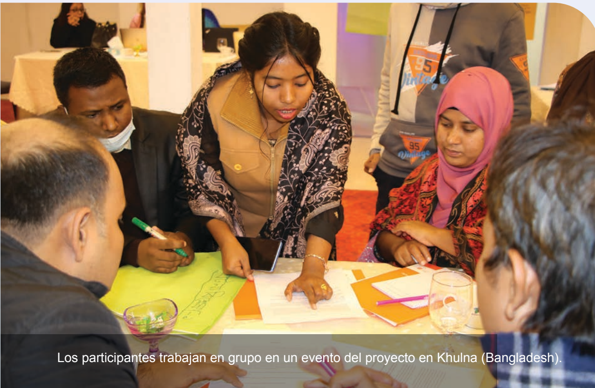
Los participantes trabajan en grupo en un evento del proyecto en Khulna (Bangladesh).