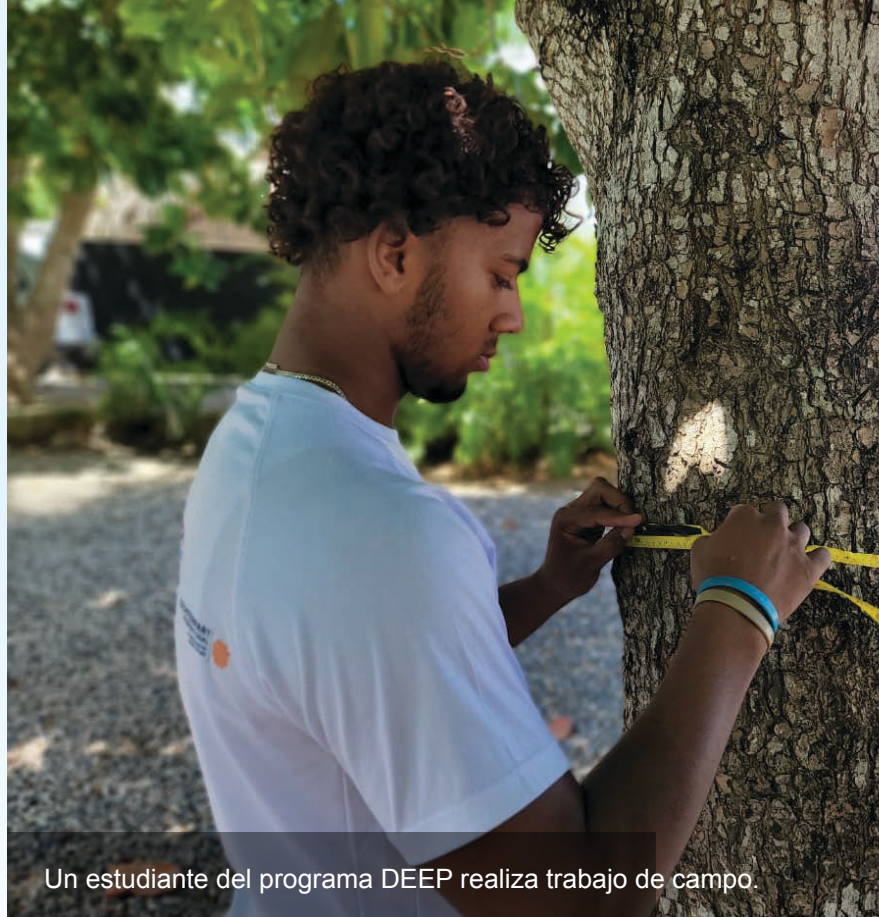
Un estudiante del programa DEEP realiza trabajo de campo.

Nuestra labor en el país da prioridad a la participación de las mujeres y las jóvenes y garantiza que las actividades subvencionadas se diseñen y ejecuten con un enfoque que reduzca las diferencias de género y promueva los derechos y la participación de las mujeres.