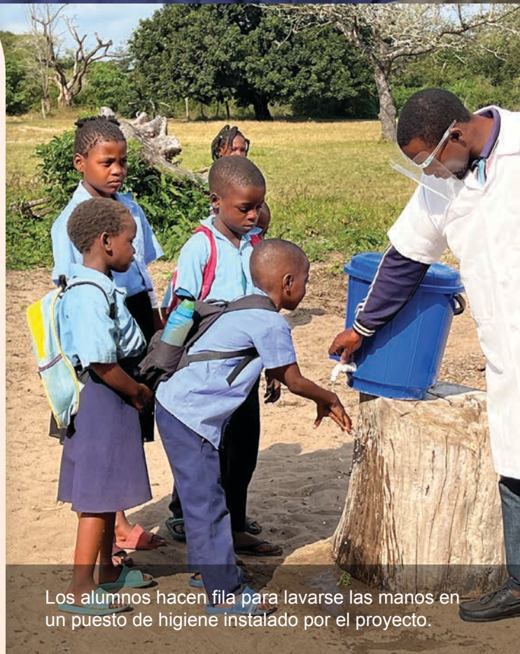
Los alumnos hacen fila para lavarse las manos en un puesto de higiene instalado por el proyecto.