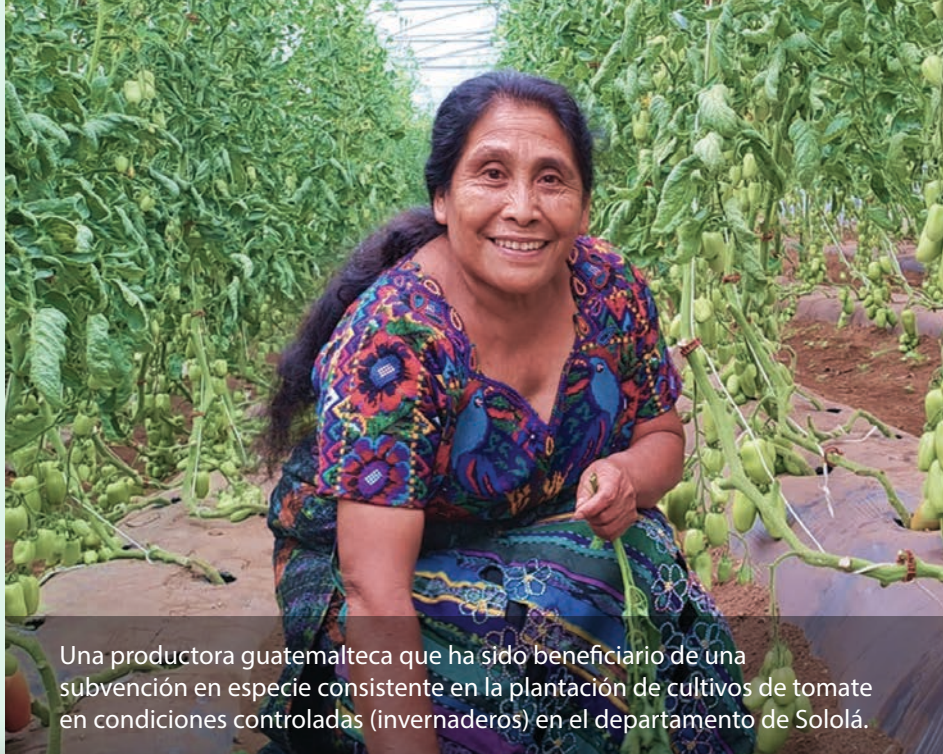
Una productora guatemalteca que ha sido beneficiario de una subvención en especie consistente en la plantación de cultivos de tomate en condiciones controladas (invernaderos) en el departamento de Sololá.

Desde su inicio en 2018, 420 agentes agrícolas se han graduado del Programa Certificado de Extensión Rural y más de 500 organizaciones agrícolas han recibido capacitación y asistencia técnica sobre conservación del suelo, gestión del agua, producción de café y horticultura, seguridad alimentaria y nutrición. También hemos capacitado a más de 36,000 productores de café, lo que se ha traducido en mayores rendimientos y mejor café.