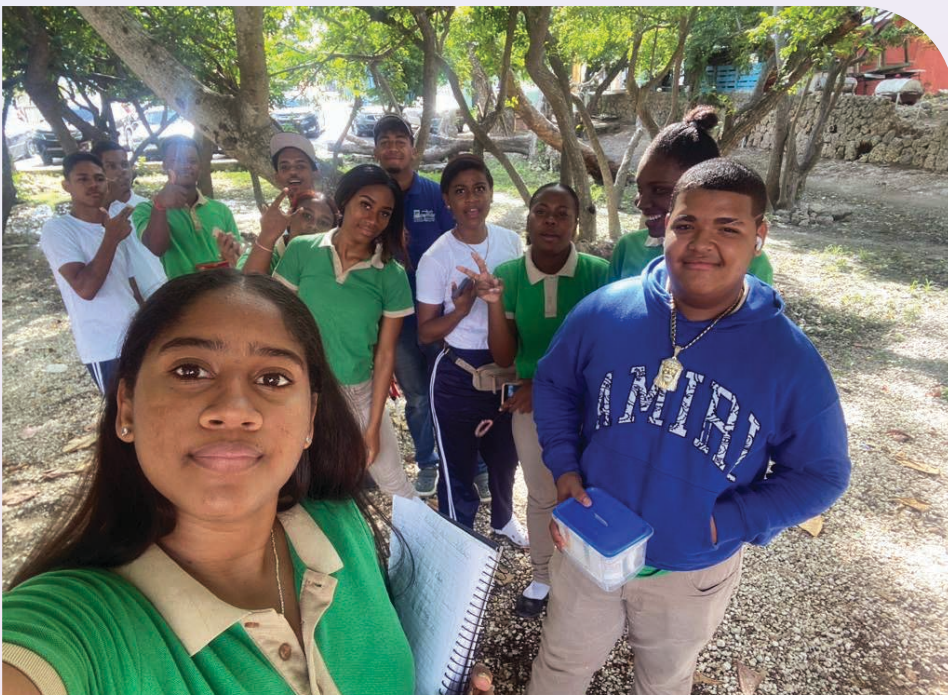
Izquierda: Estudiantes de secundaria del Programa Dominicano de Educación Medioambiental realizan trabajo de campo.